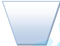
زباله ی تر