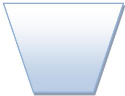
زباله ی کاغذ

روزنامه باطله ، لیوان یک بار مصرف ، پوست میوه و آجیل ، جعبه دستمال کاغذی ، بطری آب معدنی